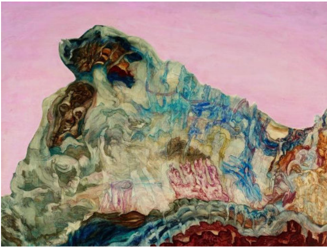
„Alturas de Macchu Picchu, CANTO I“. Öl auf Leinwand, 96,9 x 129,9cm. 1975.

Mit dieser Retrospektive ehrt die Synagogen-Gemeinde Köln das Leben und Schaffen ihres ehemaligen Mitglieds. Zur Eröffnung spricht Frau Dr. Renate Goldmann, Direktorin der VAN HAM Art Estate. In der Ausstellung werden u.a. zwei Werke aus der Serie "Noche de cristal" (Kat.-Nr. 36-37) gezeigt, in der sich die Künstlerin intensiv mit der Reichspogromnacht und der NS-Zeit auseinandergesetzt hat. Zudem wird der vollständige, zwölfteilige Zyklus "Alturas de Macchu Picchu" (Kat.-Nr. 2-13) aus den Jahren 1975 – 1978 präsentiert. Ebenso ist ein Video-Interview der Künstlerin zu sehen, das vom NS-Dokumentationszentrum der Stadt Köln herausgegeben wurde.